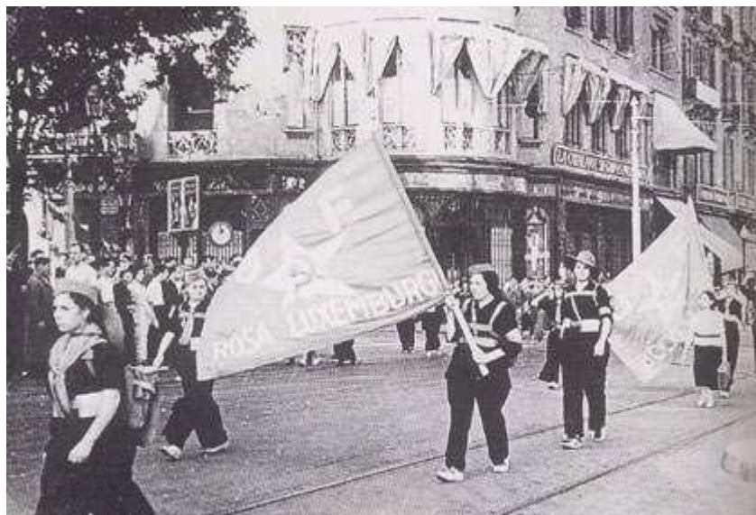
Il·lustració 8: Desfilada pels carrers de Barcelona de batallons femenins compromesos amb la lluita antifeixista

Enfront de les institucions oficials que sempre havien ignorat a les dones, sorgeix durant la guerra un interès oficial perquè ocupin càrrecs de responsabilitat, sobretot en l'assistència social. La dirigent anarquista Federica Montseny fou la primera dona ministra a Espanya. Entre 1936 i 1937 tingué al seu càrrec el Ministeri de Sanitat i Assistència Social en el govern de Largo Caballero, i a ella es deuen nombroses iniciatives en l'àmbit de l'assistència social, l'ajuda als refugiats i la sanitat pública. També es deu en gran part a ella el procés definitiu de legalització de l'avortament que la Generalitat de Catalunya promulgà al desembre de 1936. La nova situació de la dona dintre de l'Espanya republicana va arribar a tractar fins i tot l'antic problema de la prostitució i de les malalties irreversibles iniciant propostes innovadores que conduïssin a canviar la mentalitat.