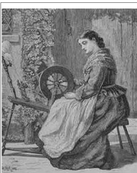
Il·lustració 1: Petits taller domèstics tèxtils de l'època.

La participació del dona en el món laboral fou elevada ja que el sistema productiu predominant era el preindustrial, el que comportava una participació de la població alta. A més, l'activitat femenina agumenta a mesura que es disminueix en l'escala social i, igualment, pot afirmar-se que l'estat civil incideix de forma determinant en la taxa d'activitat femenina, per la qual cosa solteres i vídues comprenien bàsicament el món laboral.