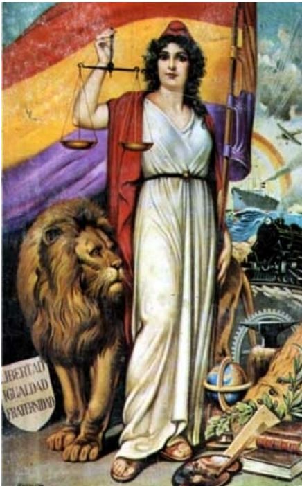
Il·lustració 2: Al fons la bandera republicana, i la dona amb la balança representa l'igualtat de drets.

La caiguda de la monarquia i l'arribada de la II República, al 1931, va suposar per a les dones conseqüències importants.