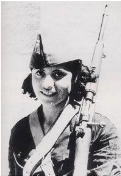
Il·lustració 7: Milliciana republicana

El fracassat alçament del juliol de 1936 va impulsar a les dones de l'Espanya republicana cap a noves activitats en el món polític i social. Encara que les reformes aplicades amb la proclamació de la República van eliminar bona part dels impediments de les dones a l'hora de l'igualtat amb el col·lectiu masculí, fou la Guerra Civil la qual li va atorgar un nou rou dintre la societat, actuant d'impulsor de la mobilització femenina.