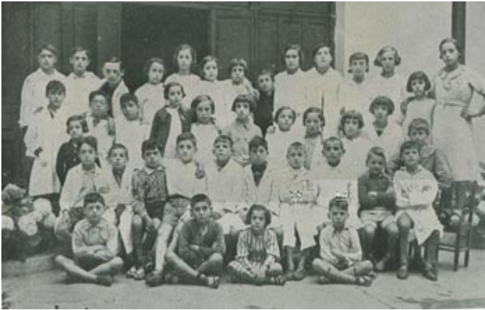
Il·lustració 4: Escola mixta durant la II República

Endinsant-nos en la situació de Catalunya, fins i tot, va arribar més lluny oferint la difusió d'anticonceptius. A més, es va despenalitzar i legalitzar l'avortament. Es va decretar l'abolició de la prostitució reglamentada i es va prohibir contractar a dones en treballs considerats perillosos o massa durs.