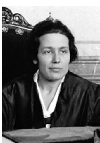
Il·lustració 5: Victòria Kent

La jurista espanyola nascuda el 6 de març de 1898, comença els seus estudis elementals a casa amb professors particulars per després assistir a l'Escola Normal de Mestres i en 1917 es traslladà a Madrid a estudiar el Batxillerat a l'Institut Cisneros. En finalitzar-lo, entrarà a la Facultat de Dret (1920) on cursa la carrera fins a llicenciar-se al 1924.