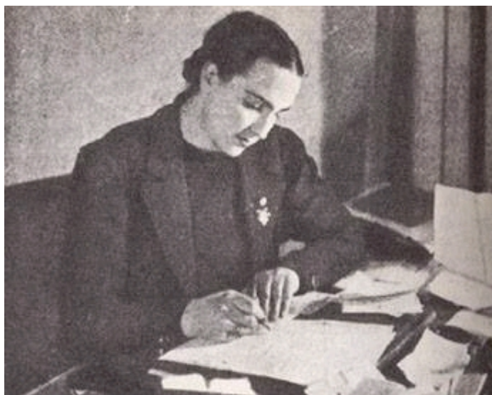
Il·lustració 12: Mercedes Sanz Bachiller, delegada nacional de l'organització assistencial Auxili Social

Primo de Rivera i Mercedes Sanz Batxiller al llarg de 1939 va dur a la Secció Femenina a exigir un nou decret que li lliurés el Servei Social. Finalment, aquest servei va quedar inscrit a la Secció Femenina pel decret del 28 de desembre de 1939 encara que aquesta va ser l'única victòria, almenys durant la guerra i principis de postguerra, que Pilar Primo de Rivera va obtenir sobre la delegada nacional d'Auxili Social.