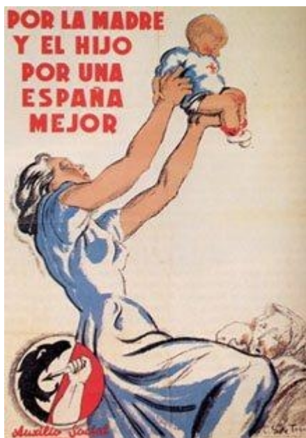
Il·lustració 10: Cartell que reivindica el paper de la dona en l'Espanya nacional

L'associació de Falange Espanyola de les JONS 6 , amb el naixement del règim nacional, va possibilitar que la dona, com col·lectiu social, fora inclosa en el nacionalsindicalisme 7 a través de la seva Secció Femenina. Aquesta organització, fundada al juny de 1934 per José Antonio Primo de Rivera, que tenia com a objectiu l'assistència als presos del Partit o de les famílies dels caiguts en les lluites rondaires, trobarà ara després de l'esclat de la guerra, una veritable raó de ser. Al capdavant d'ella es va nomenar cap nacional a Pilar Primo de Rivera. Estava dotada d'una organització jeràrquica, piramidal. Fins al 18 de juliol de 1936, la xifra més creïble era la de menys de 2.500 afiliades. A partir d'aquí el seu nombre va augmentar considerablement dintre del nucli de guerra en què es trobava. Les dones de la Falange a causa de les necessitats de la guerra van ser destinades a ocupar funcions tals com la d'organitzar la secció d'infermeres, a establir associacions de beneficiència i atenció als orfes, etc. El 6 de gener de 1937 es reuneix el I Congrés Nacional de Secció Femenina en el qual es donen les primeres regles per a l'extensió organitzativa d'infermeres, safarejos, tallers i auxili d'hivern. La seva organització constava de cinc departaments, al capdavant de cadascun d'ells es trobava una delegada nacional nomenada per Pilar Primo de Rivera. Aquests departaments o delegacions eren: Premsa i Propaganda, Administració, Infermeres, Auxili d'Hivern i Fletxes.