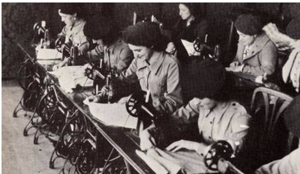
Il·lustració 11: Margarides cosint roba d'abric per als combatents en un taller