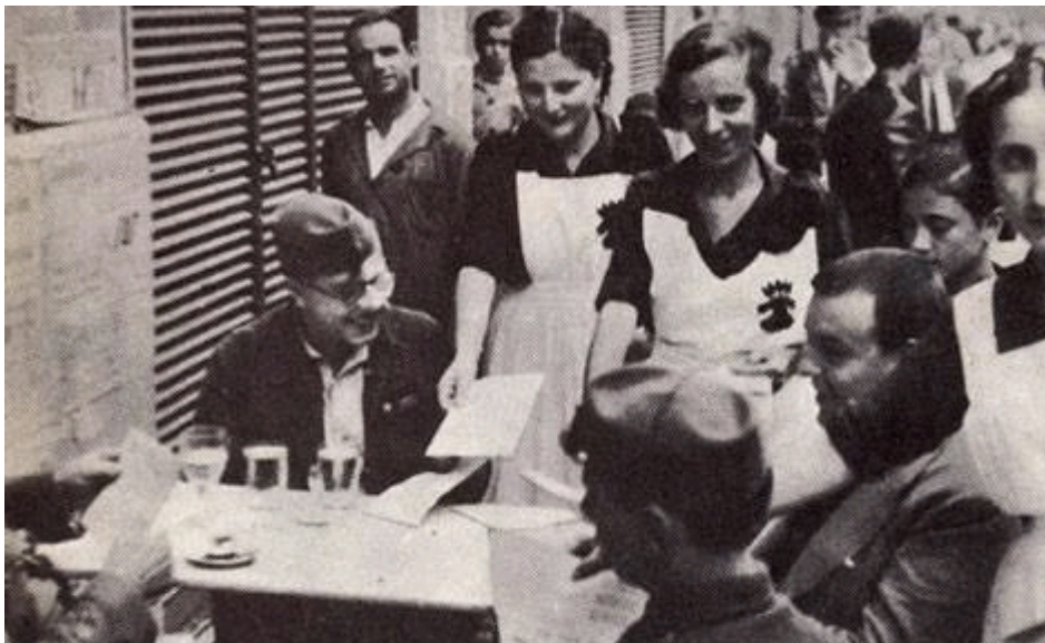
Il·lustració 10: Col·lecta organitzada per la Secció Femenina de la Falange