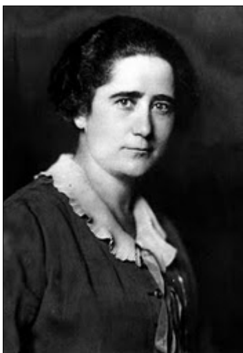
Il·lustració 6: Clara Campoamor

Neix a Madrid, el 12 de febrer de 1888. En el nucli d'una família humil. La seva mare modista, i el seu pare contable d'un periòdic.