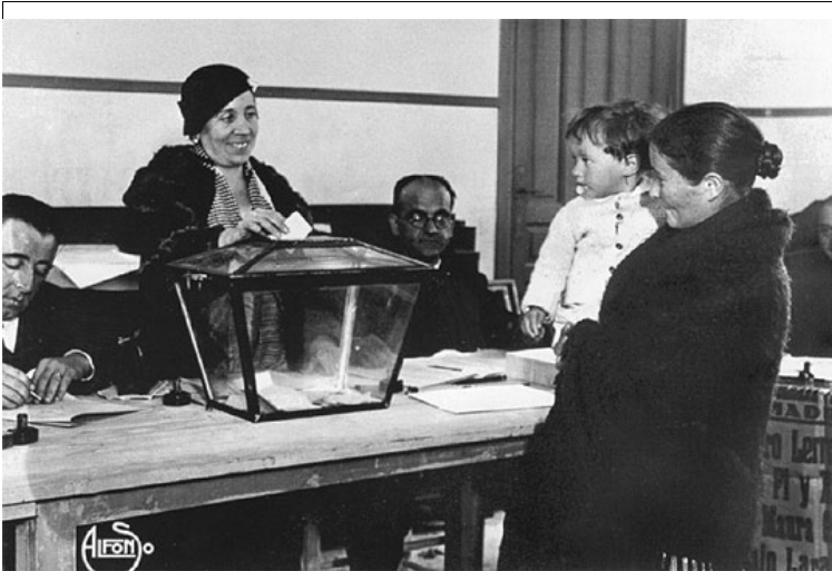
Il·lustració 3: Primeres eleccions amb el vot femení aprovat.

L'activitat política considerada fins llavors com un privilegi dels homes, va suposar l'aparició de moviments socials format per dones implicades en organitzacions polítiques i sindicalistes, premsa...tot això es va convertir en un factor important per a la vida política del país.