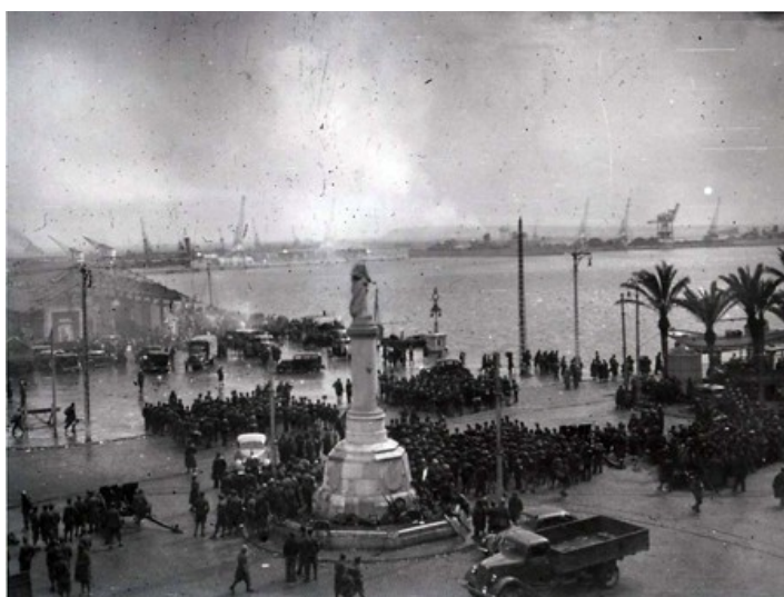
Imatge 3. 31

L'experiència col·lectivista que es va desenvolupar a Catalunya entre juliol de 1936 i gener de 1939, tot i que no va poder dur a terme els seus objectius a causa de les dificultats amb què va haver d'enfrontar, constitueix una de les transformacions més radicals del segle XX. Aquesta transformació va afectar tots els aspectes de la vida política, econòmica, social i cultural no només de la regió sinó del país sencer. El 26 de desembre 1938, Catalunya va caure.