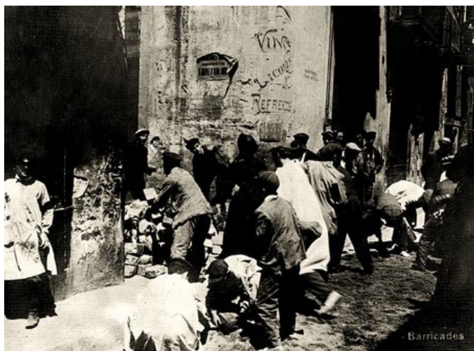
Imatge 1. Aixecada de una barricada durant la Setmana Tràgica. 8

Va ser la resposta, sobretot, de tota una sèrie de canvis estructurals que, des de finals del segle XIX, s'estaven apuntant en el conjunt de la societat catalana. Aquests canvis van ser polítics, culturals, socials i econòmics derivats de la crisi colonial espanyola del 1898.